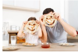
ONLINE-SEMINARE FÜR FAMILIEN ZU ERZIEHUNGS- UND FAMILIENTHEMEN