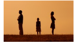
ANGEBOTE FÜR FAMILIEN IN TRENNUNG