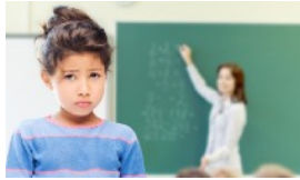
PRÄVENTIONS- KURSE FÜR SCHUL- KLASSEN